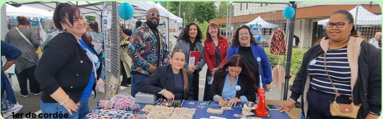
1er de cordée

Le 6 juin, la fête associative a réuni jeunes, familles, professionnels et partenaires autour d'un beau moment de partage. Sourires, rencontres et convivialité étaient au rendez-vous. Une journée chaleureuse, portée par l'énergie et la présence de chacun.